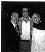
Romano «al Plebiscito»

Dopo la degustazione delle specialità della casa, i numerosi antipasti, l'ottima pizza,